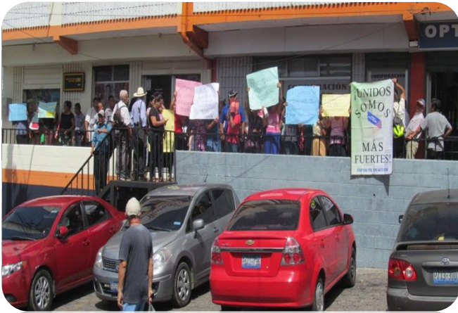
Líderes manifestándose en las afueras de las oficinas de Argos en Zacatecoluca.

Los líderes cansados de tantas mentiras que la corporación Argos viene diciéndoles desde hace más de 12 años, deciden el día martes 23 de julio del 2019, llegar a la oficina departamental de dicha corporación, ubicada en el edificio Argoz de la ciudad de Zacatecoluca.