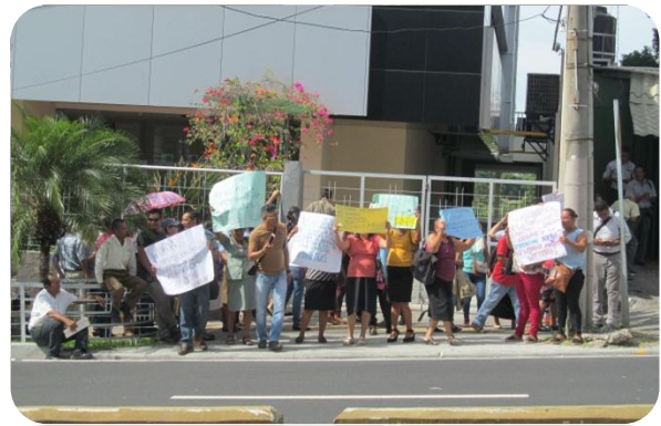
Líderes marchando en las afueras de la oficina de Argoz en San Salvador.

Los líderes les dieron un plazo de 30 días para que resolvieran tal situación, puesto que ya se estaban contactando con otras comunidades y que si ésta vez fueron 100 líderes, la próxima vez iban a ser más de 500 líderes.